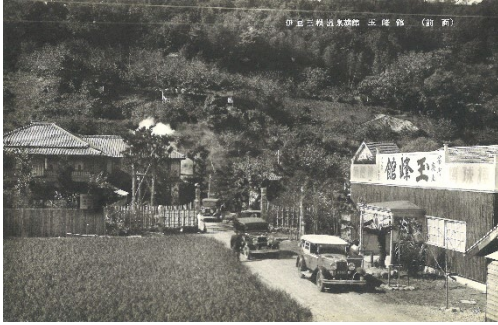
【開業当時の玉峰館】

大正15年(1926年)11月22日正午、突然の大きな音とともに、地上約50mの上空を突き刺すほどの大噴湯が発生しました。この奇跡の源泉を多くの方に愉しんでもらいたいとの思いから、同年「玉峰館」は開業しました。以来、湯とともに歴史を重ね、玉峰館は創業100周年を迎えました。その源泉は、今もなお絶えることなく湧き続けています。