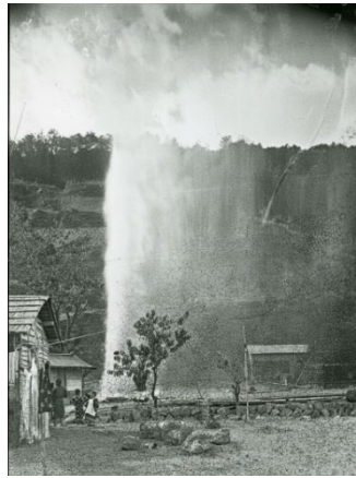
【源泉が噴出する様子】