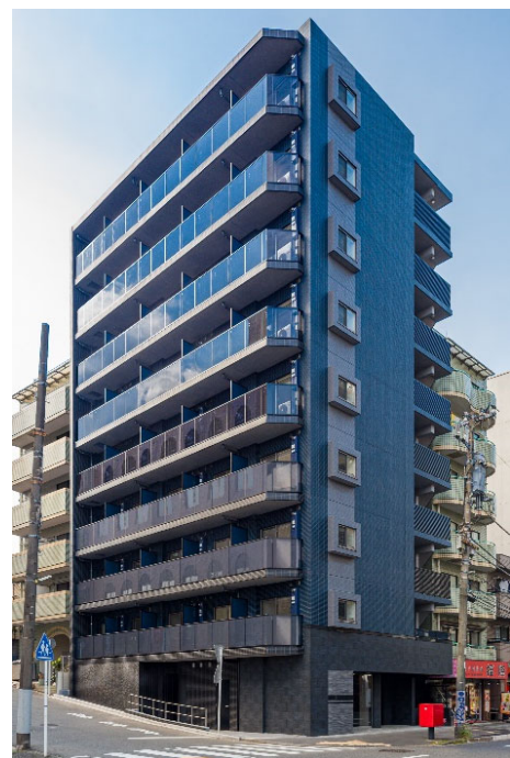
【ガーラ・シティ横浜反町】