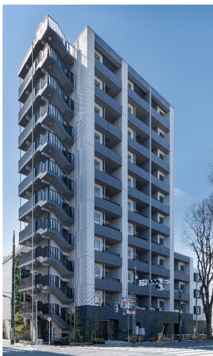
【ガーラ・アヴェニュー調布】