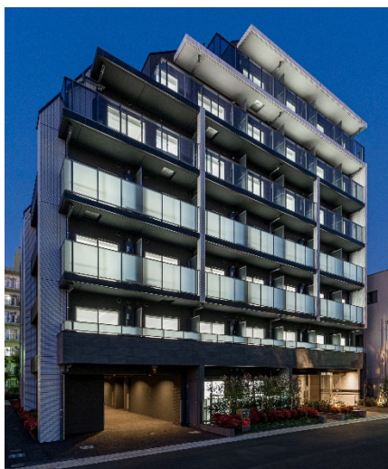
【ガーラ・プレシャス横浜鶴見】