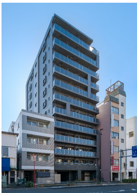
【ガーラ・グランディ深川住吉】