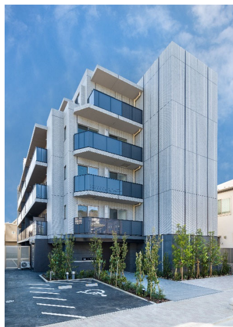
【ガーラ・パークヒルズ武蔵小山】