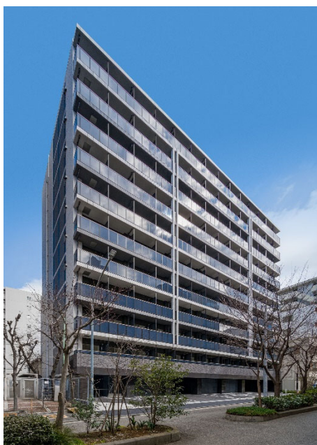
【ガーラ・プライム横濱関内】

当社グループは、今後も上質なデザインを追求した外観やエントランス、安全性・快適性を重視した設備仕様など、居住者目線に立ったマンションの企画・開発を進めてまいります。