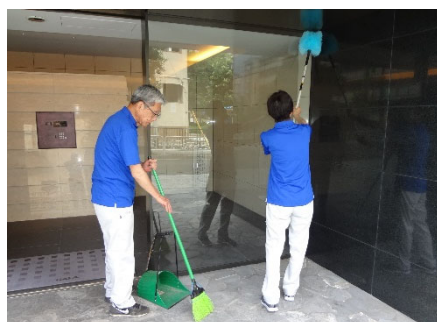
[ユニフォームイメージ]