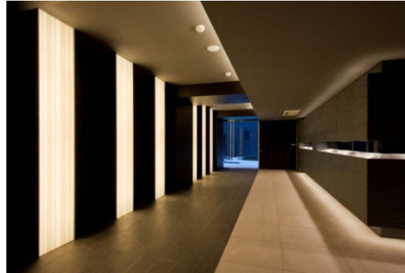
【エントランスホール】