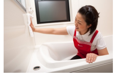
【家事代行サービスイメージ】