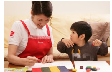
【ベビー&キッズシッターサービスイメージ】