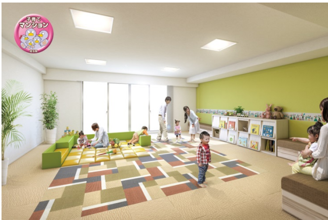
【キッズ&コミュニティスペースイメージ】

埼玉県子育て応援マンション認定制度は、マンションの住戸内、共用部などの仕様や子育て支援サービスの提供など、ハード・ソフトの両面において子育てに配慮したマンションを埼玉県が認定する制度です。