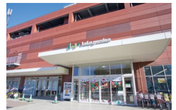
【ララガーデン川口(約480m)】