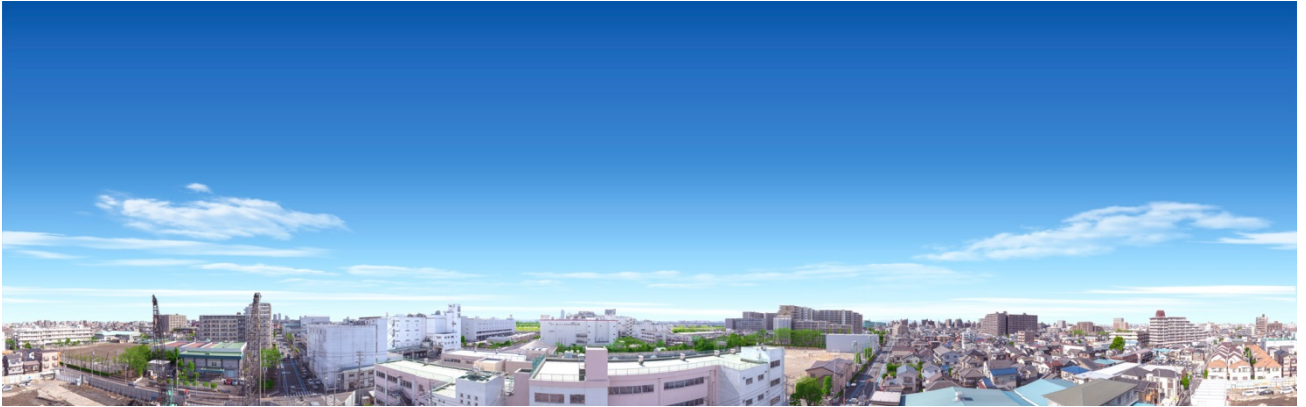
【現地南側眺望イメージ】

※「第一種住居地域」とは都市計画法で「住居の環境を保護するため」に定められる用途地域。3,000平方メートル以上の店舗・事務所や、住環境を害する工場・遊技場・娯楽施設などは建設することはできません。