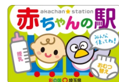
赤ちゃんの駅 ステッカー

「赤ちゃんの駅」とは埼玉県が進める乳幼児を持つ子育て家族が安心して外出できる環境づくりで、多様な事業者等の協力の下、広く県内に設置を進めている誰でも自由におむつ替えや授乳ができるスペースの愛称です。