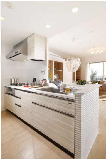
【対面カウンターキッチン】

その他、子どもの成長に合わせて容易に間取り変更できる工夫などを取り入れています。