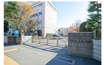
【戸田第二小学校(約110m)】